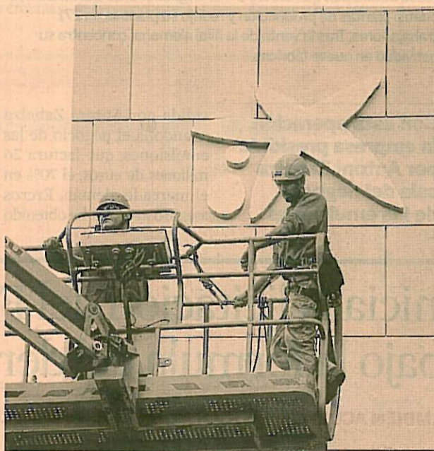
La estrella de La Caixa ya luce en lo alto de la sede central de Girona.

Asimismo, también el 1 de enero de 2011 el servicio Oficin@24 horas de Caixa Girona pasará a ser Línea Abierta -el servicio de banca a distancia de La Caixa-.