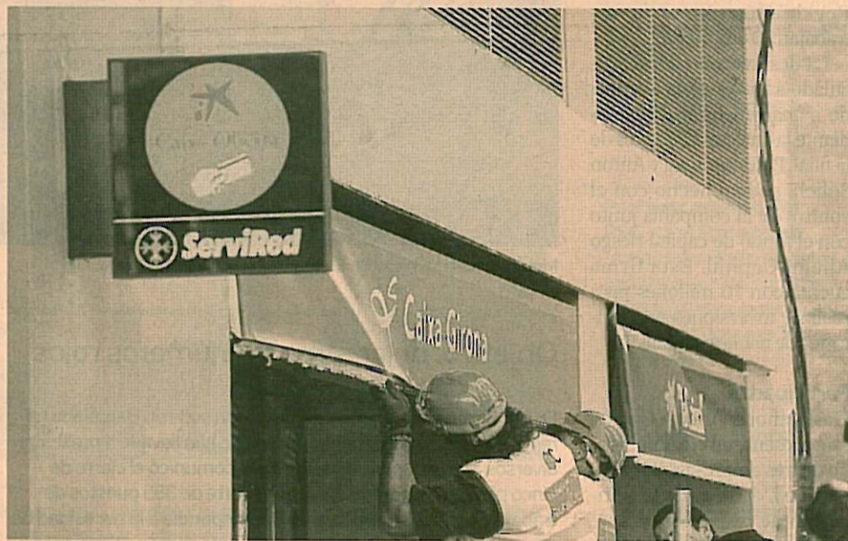
Unos operarios sustituyen los rótulos de Caixa Girona por los de La Caixa en una de las oficinas.

Las tarjetas de Caixa Girona serán sustituidas por tarjetas de La Caixa a partir del 1